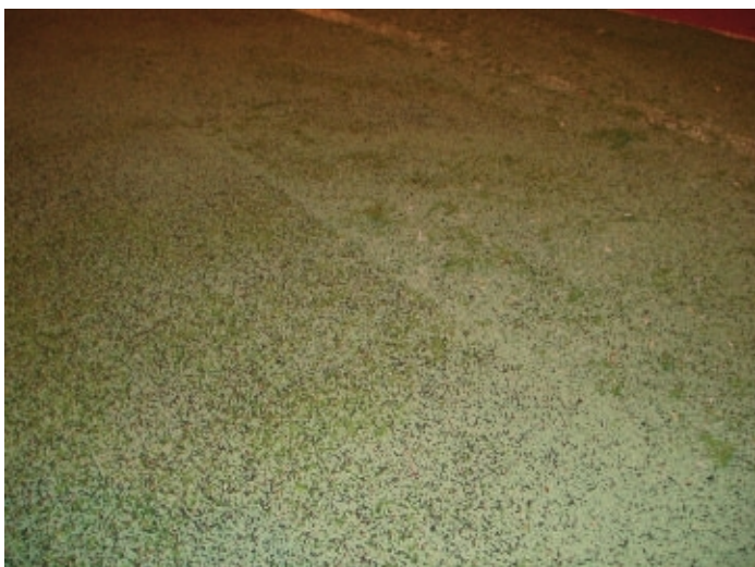
Ero puhdistetun ja puhdistamattoman alueen välillä.

Pölyongelmat ovat suuret sisähalleissa koska kumirouhe/hiekka murtuu käytössä pölyksi. Hengitysongelmat lisääntyvät ja allergiaongelmat kasvavat, halleissa on epäpuhdas ilma. Kenttien pinta kovenee jos täyttöaine on likaantunut ja tiivistynyt liaksi ja tekonurmikentän veden läpäisy huononee. Ulkokentissä vesi ei pääse läpi, kenttä on kauan märkä sateen jälkeen. Sammal kasvaa.