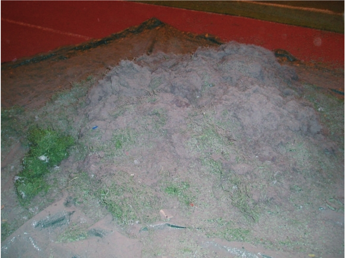
Tellushallin tekonurmikentästä koneen keräämä roskakasa.

Meillä on Saksassa kehitetty erikoiskone ja suoritamme puhdistuspalveluja ammattitaidolla. Kone harjaa (1) talleantunutta nurmea pystyyn nukkalankaa vahingoittamatta, nostaa täyttöaineen joka sisältää kumirouhetta/hiekkaa sekä epäpuhtauksia ja hienoaineksia. Materiaali erotellaan sihdin läpi (2) jonka jälkeen oikeakokoinen kumirouhe/hiekka laskee takaisin tekonurmikenttään jonka jälkeen sitä tasataan harjan avulla (3) ja painetaan kevyesti tekonurmeen painotelan avulla (4) Sen jälkeen pintaharja (5) tasaa pintakerroksen.