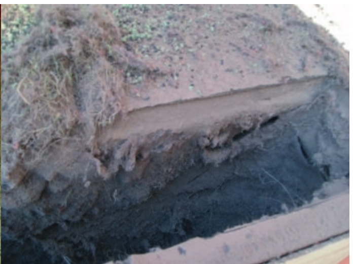
Koneen pölysuodatin tunnin puhdistuksen jälkeen.